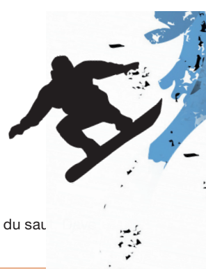
figure aérienne n. f. allez-hop n. m. planche à neige alpine n. f. surf des neiges alpin n. m. planche à neige alpine n. f. surf des neiges alpin n. m. andrecht n. m. Note : D'après le nom de l'inventeur du saut Andrecht, planchiste à roulettes.

B backside air backside position backside rotation backside turn