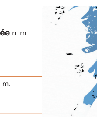
figure aérienne renversée n. f. figure aérienne inversée n. f.